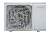
1U 018 NBR