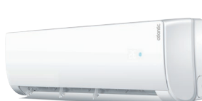
AS 007 à 012 NB