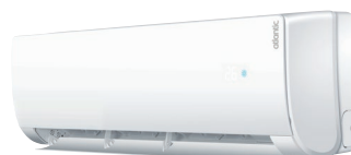
AS 018 NB