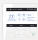
Télécommande filaire YR-E16A