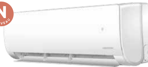
VERSION CHAUD SEUL SELON MODÈLE