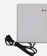
Platine interface pour le raccordement de la télécommande filaire WK-B