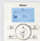
BRC073 en option.