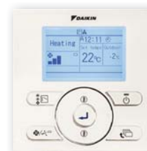
En option (BRC073)