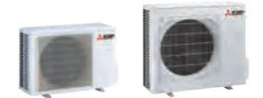
MUZ-FT 25 VGHZ