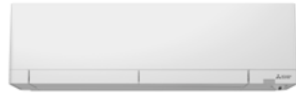
MSZ-RW 25/35/50 VG

RETROUVEZ TOUTES LES DONNÉES DE CE PRODUIT EN SCANNANT CE QR CODE